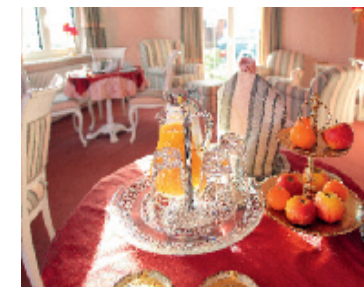
Frühstücksraum Haus Myrthe