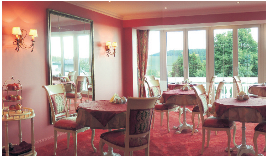
Frühstücksraum Haus Zeder