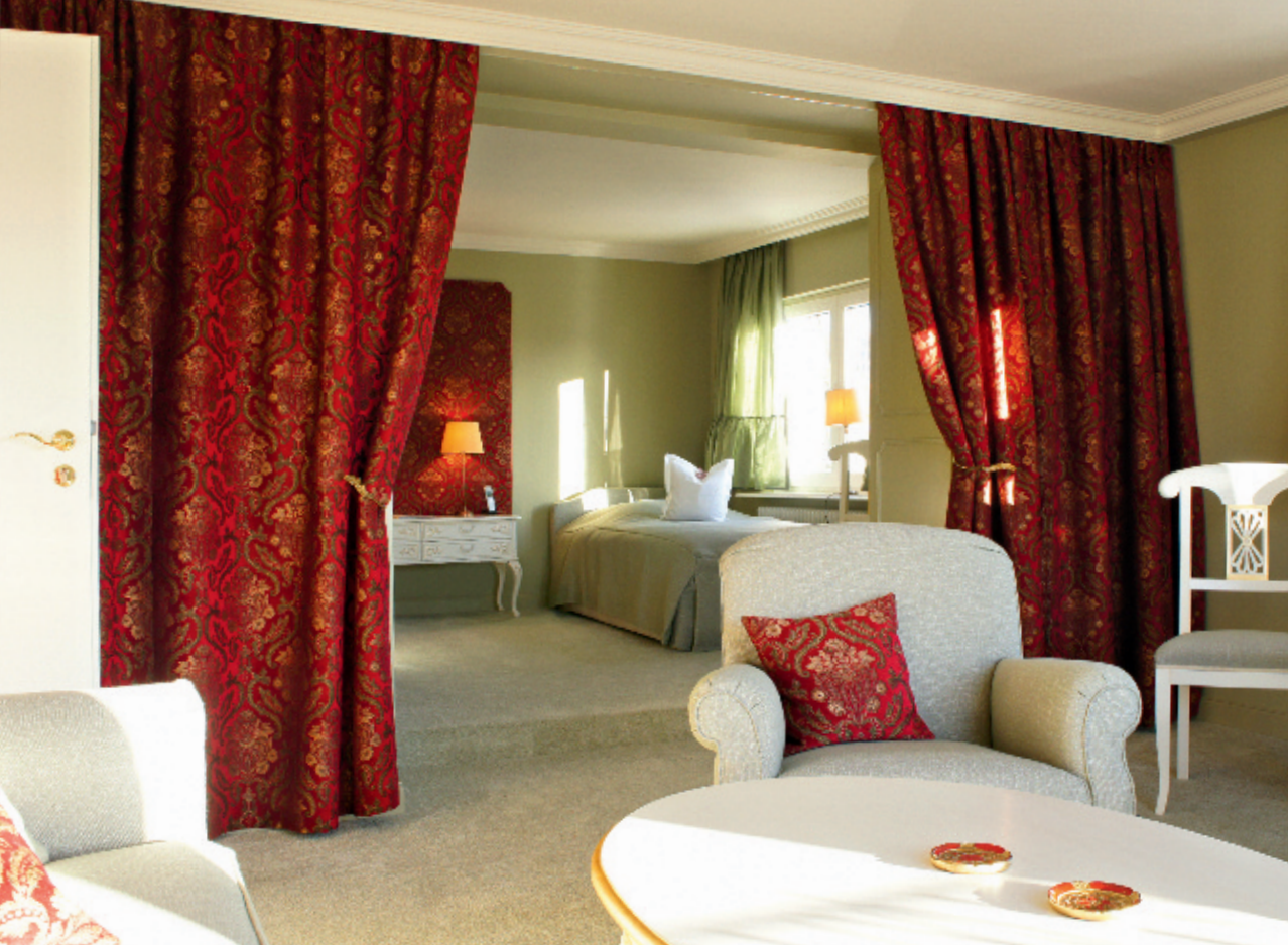
Der leicht erhöhte Schlafbereich mit zwei Betten ist wahlweise mit dem edlen Samtvorhang schließbar.